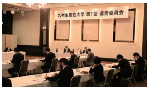
第63期九州生産性大学経営講座 運営委員会の様子

そして、九州生産性大学運営委員会ではカリキュラムの審議および効果的な講座運営はもとより、提出された修了レポートの審査など全面的なご協力をご支援をいただいております。