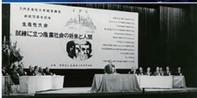
九州生産性大学創設10周年記念生産性大会

九州生産性大学は九州産業界における人材養成機関として、今後も九州地域における人材養成の要として、当地域に貢献できる人材を輩出してまいります。