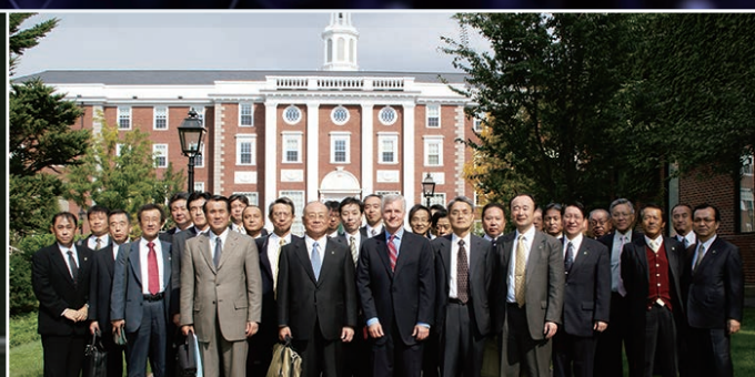
九州生産性大学創設60周年記念アメリカ視察研修団(ハーバード・ビジネススクールにて)