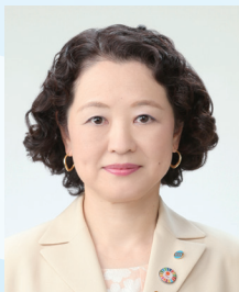
日本労働組合総連合会 会長

1987年3月同志社大学工学部化学工学科卒業。1987年4月株式会社村田製作所入社。薄膜微細加工技術開発に従事した後、2012年7月モジュール事業本部技術統括部薄膜技術部部长として、SAWデバイス、MEMSセンサなど薄膜商品の開発を担当。2018年4月同統括部ネットワーク技術開発部部长を兼務。2019年4月企画管理本部人事グループ統括部部长、2025年7月から現職。2026年7月常務執行役員（就任予定）