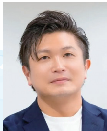
(株)広沢自動車学校 代表取締役

【沿革】2018年2月にメルカリグループが福岡市で開始した「メルチャリ」からスタートし、同年6月には福岡市と連携し、「福岡スマートシェアサイクル実証実験事業」を開始するなど、都市型モビリティサービスとしての基盤を構築。2019年7月には、(株)ソウゾウ(メルカリグループ)からの新設分割により、シェアサイクル事業を担う新会社として設立。2020年4月にサービスブランド名を「メルチャリ」から「チャリチャリ」へ変更。2024年4月には、社名を「neuet(株)」から「チャリチャリ(株)」へ変更し、サービスブランドと企業名を統一。2025年には、京都の老舗自転車店「きゅうべえ」が運営するシェアサイクル事業「kotobike」を承継し、2026年には同エリアを「チャリチャリ」ブランドへ統合し、関西エリアでの本格展開を開始。