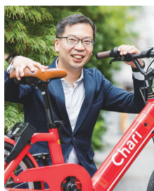
チャリチャリ(株) 代表取締役社長