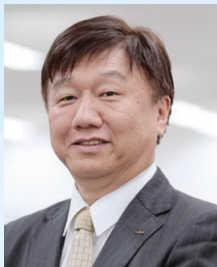
株村田製作所 上席執行役員 管理本部 本部長 (※2026年7月常務執行役員就任予定)