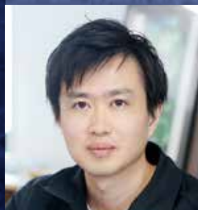
株式会社QPS研究所 代表取締役社長 CEO