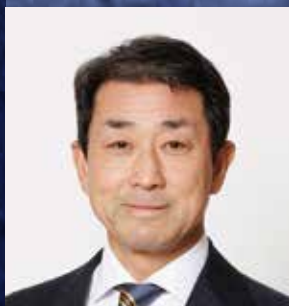
トヨタ自動車九州株式会社 代表取締役社長