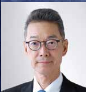
福岡国際空港株式会社 代表取締役社長執行役員