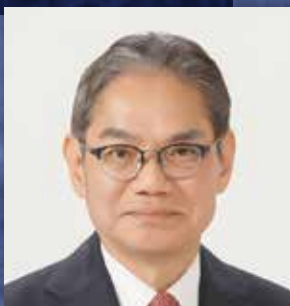
株式会社クラフティア 代表取締役社長執行役員