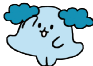
創立70周年記念 オリジナルキャラクター プロプロ

【地下鉄】(七隈線) 渡辺通駅下車(電気ビル本館B2Fへ直結) 【西鉄】西鉄薬院駅より徒歩7分 【バス】・JR博多駅バス停B番より発車する全て(薬院・六本松方面)に乗車可能(10分)→渡辺通1丁目G降車すぐ ・JR博多駅バス停A番より300番台(みずほPayPayドーム福岡方面)、BRT(接続バス)もしくはK(九大伊都キャンパス方面)に乗車(10分)→渡辺通1丁目電気ビル共創館前降車すぐ ・天神大丸前バス停4Cより乗車(5分)→渡辺通1丁目電気ビル共創館前降車すぐ 【タクシー】天神より5分、JR博多駅より7分、福岡空港より25分